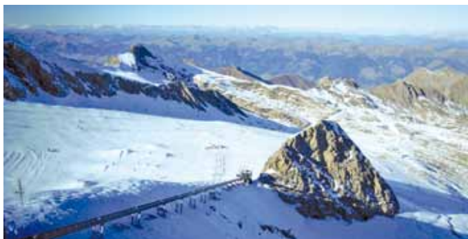
▲ Kitzsteinhorn Gletscher

ganisierte für dieses Training das Hotel, die Liftkarten und alles was noch bei so einem Training dazu gehört, Danke.