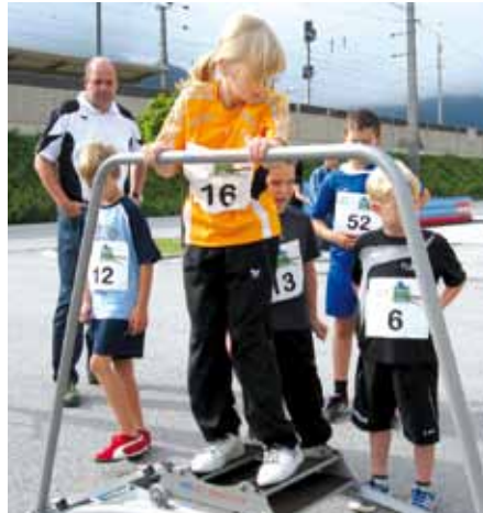
▲ Grosses Interesse am Carving Simulator

Wir waren mit vollem Einsatz und Freude dabei, stellten unser Skiteam mit einigen Aktivitäten, wie Slalom mit Inline – Skaten, Slackline und Carving Simulator vor. Die Skiteamhütte war unser Infostand mit der Präsentation einer DVD- Show. Unser Team übernahm die Bewirtung für die gesamte Veranstaltung. Danke an die Marktgemeinde Krieglach und unseren Mitgliedern für die Mitarbeit.