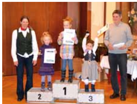
▲ So sehen Sieger aus