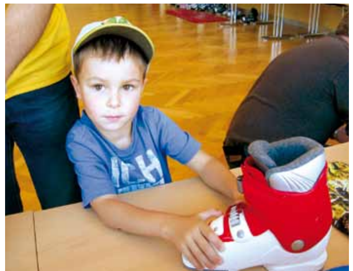
▲ Alexander: „Papa den kaufen wir.“