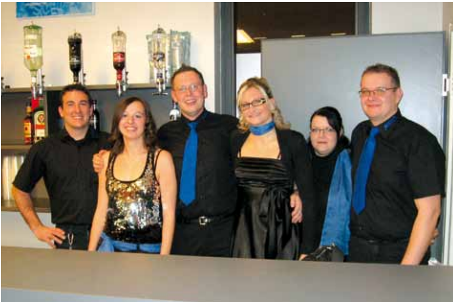
▲ Von uns aus kann es losgehen - das Discoteam

Fotos auf www.skiteam-krieglach.at Picasa Webalbum