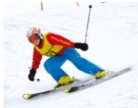
▲ 13. Platz BC Schnittler Felix K5m