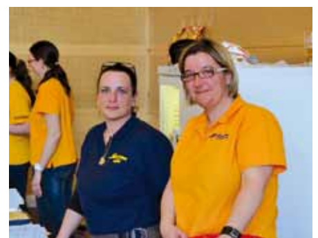
▲ Unsere fleißigen Damen ...