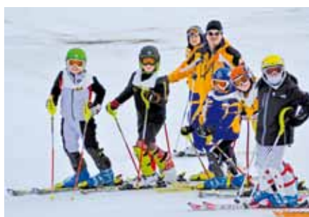
▲ Gruppe bei Lauf Besichtigung