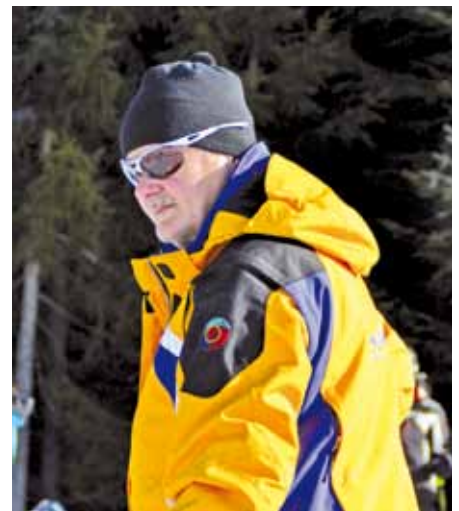
▲ Waun da Fraunz net hüft ...