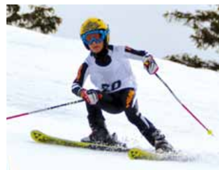
▲ 12. Platz BC Hofer Alex K2m

Dann lange, lange Pause da durch Schneefälle, Wind und Kälte nach und nach alle Rennen verschoben wurden.