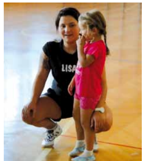
▲ Is die Lisa aufschmissn ...