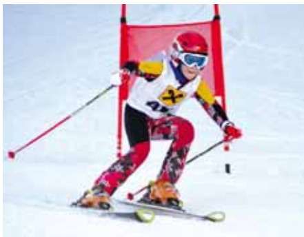
▲ 9. Platz BC Karlsböck Paula K3w