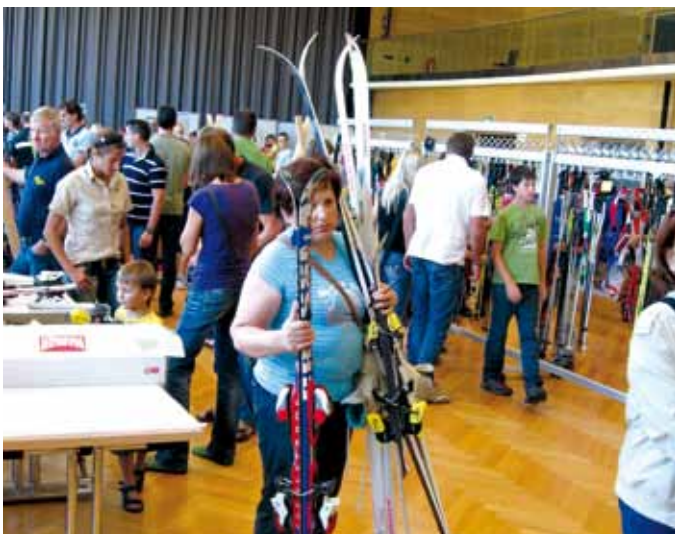
▲ Der Winter kann kommen