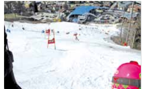
▲ Zielhang in das Planai Stadion