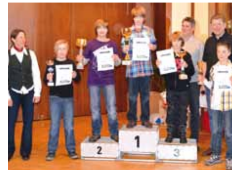
▲ Vereinsmeister „Oli“