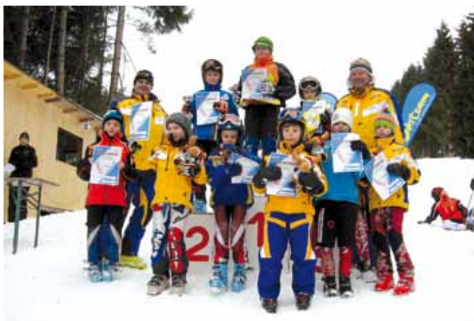
▲ Siegerehrung K2 m